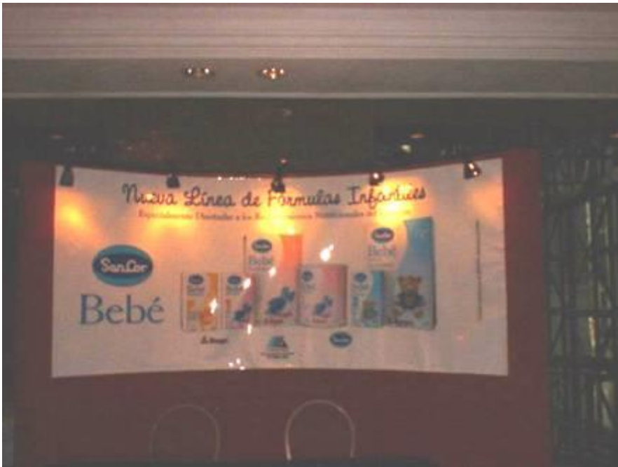
Figura 8. Presentación de toda la línea de Fórmulas de la Empresa en el Congreso.

El Artículo 7 párrafo 7.2 del Código , dice al respecto “La información facilitada por los fabricantes y los distribuidores a los profesionales de la salud acerca de los productos comprendidos en las disposiciones del presente Código debe limitarse a datos científicos y objetivos y no llevará implícita ni suscitará la creencia de que la alimentación con biberón es equivalente o superior a la lactancia natural. Dicha información debe incluir asimismo los datos especificado en el Artículo 4 párrafo 4.2 que expresa lo siguiente: los materiales informativos y educativos, impresos, aditivos o visuales, relacionados con la alimentación de los lactantes y destinados a las mujeres embarazadas y a las madres lactantes y niños de corta edad, deben incluir datos claramente presentados sobre: a) ventajas y superioridad de la