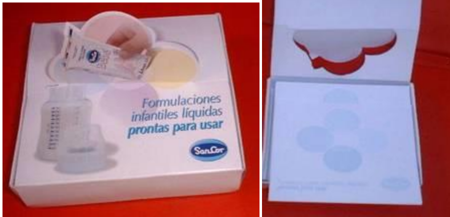
Figura 3. Block de notas ETIQUETADO