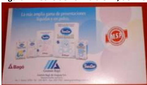
Figura 2. Almanaque