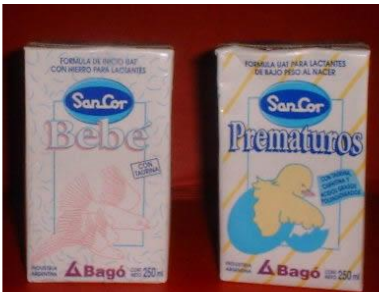
Figura 1. Leche de Fórmula UAT, de inicio para lactantes y de lactantes de bajo peso

El Artículo 6 párrafo 6.3 del Código expresa lo siguiente: “Las instalaciones de los sistemas de atención de salud no deben utilizarse para exponer productos comprendidos en las disposiciones del presente código o para instalar carteles relacionados con dichos productos, ni para distribuir materiales facilitados por un fabricante o un distribuidor, a excepción de los provistos en el párrafo 4.3 que dice “ Los fabricantes o distribuidores solo podrán hacer donativos de equipo o de materiales informativos o educativos a petición y con la autorización escrita de la autoridad gubernamental competente o atendándose a las orientaciones que los gobiernos hayan dado con esa finalidad. Ese equipo o esos materiales pueden llevar el nombre o el símbolo de la empresa donante, pero no deben referirse a ninguno de los productos comerciales comprendidos en las disposiciones del presente código y sólo se deben distribuir por conducto del sistema de atención de salud”.