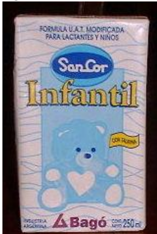
Fig. 5 Fórmula Infantil líquida de seguimiento