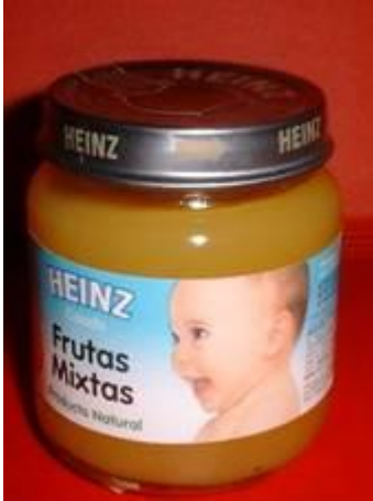
Figura 14. No aclara edad de uso