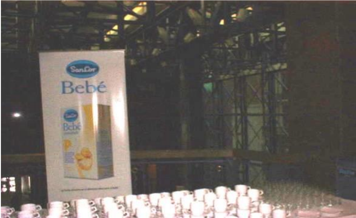
Figura 7. La Fórmula Sancor Prematuros, cambiara su nombre a Sancor P y el dibujo infantil es más llamativo.