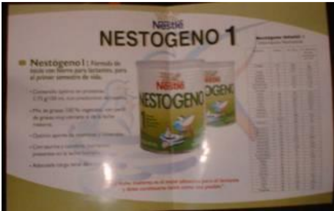
Figura 10. Fórmula de inicio con hierro para lactantes, para el primer semestre de vida.