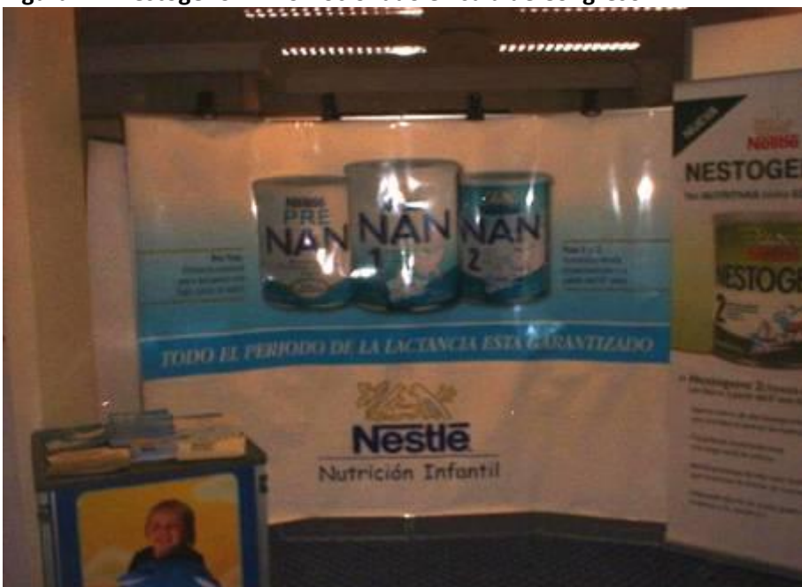
Figura 12. Stand de Nestlé en el Congreso