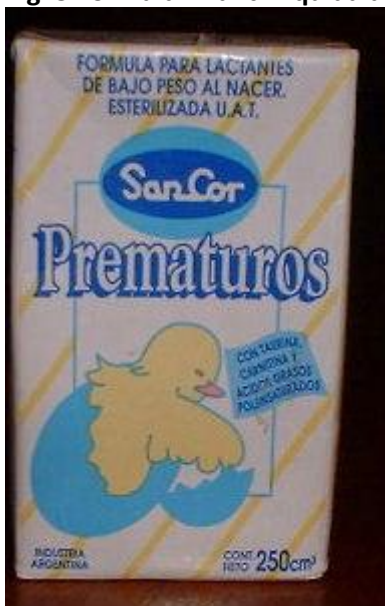
Fig. 6 Fórmula Infantil líquida para prematuros y bajo peso