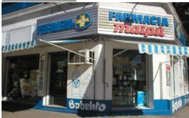
Figura 13. Paredes externas pintadas con el nombre y el logo (osito) de la empresa.

La empresa Babelito, de productos infantiles, como mamaderas, chupetes y otros, ha pintado las paredes externas de algunas Farmacias con su logo, a cambio de la exclusividad en la venta de sus productos y de que estos se exhibieran de forma especial.