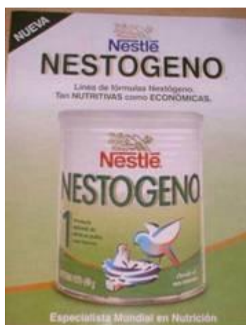
Figura 9. Nueva Fórmula “tan NUTRITIVA como ECONÓMICA”. El mensaje no es científico.